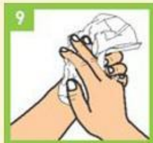
Добро обришите руке