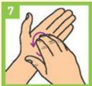
Кружно, прстима трљајте длан