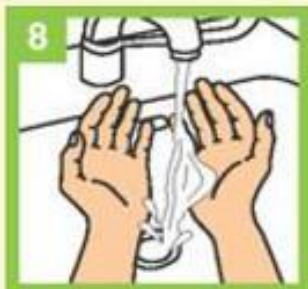
Темељно исперите сапуницу