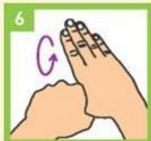
Дланом перите палац супротне руке