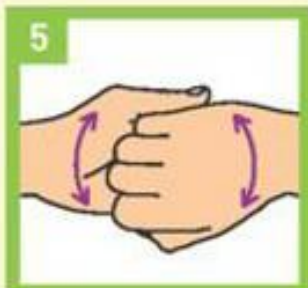
Трљајте руке скупљеним прстима