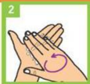
Трљајте длан о длан