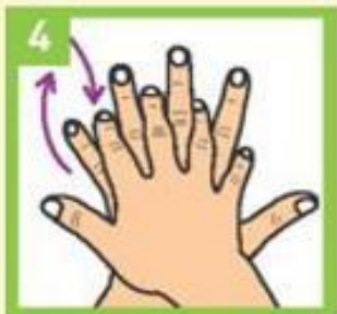
Дланом трљајте горњи део шаке